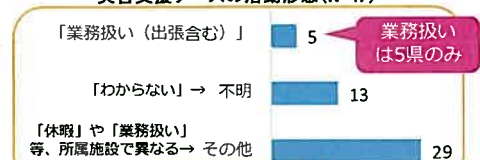
災害支援ナースの活動形態(N=47)