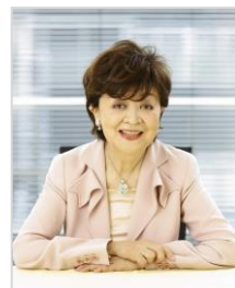
特別審査員 内館牧子さん

素晴らしい作品を通じて看護の大切さを感じていただく機会となりますので、より多くの方々にご参加いただけますよう、報道関係の皆さまには、募集案内の告知へのご協力をお願い申し上げます。