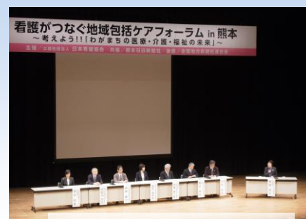
熊本会場のリレートークの様子

日本看護協会では、2015年度の重点政策「地域包括ケアシステムの構築と推進」に基づき、熊本県と静岡県の2県で「看護がつなく地域包括ケアフォーラム」を企画しました。この度、ご案内の静岡会場に先立ち1月9日（土）に開催した熊本会場には、約1,000人の来場があり、地域包括ケアに対する地域の方々の強い関心が伺えるものとなりました。