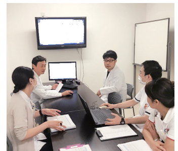
多職種とのカンファレンス

自施設での特定行為研修の実習期間中から、主治医と指導医である緩和ケアチームの医師の両名に記録等を確認してもらうことで、医師に特定行為研修の内容を理解してもらうきっかけになった。また互いの専門性を知ることにより、信頼関係がより深まり、研修修了後も円滑に協働できている。