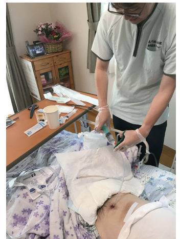
在宅療養者の膀胱瘻カテーテルの交換

実際に在宅療養の場で特定行為を行うことで、医療機器交換のための受診を減らすことができ、移動や診察待ちなどの患者・家族の負担軽減につながっている。また、特定行為研修で学んだ様々な症候の病態をアセスメントする知識・技術、診断・治療に至る原則等が基盤となり、これまでよりも患者さんを多角的に捉え病態を正しく把握できるようになった。在宅でのタイムリーな介入によって重症化を予防することは、患者さんの身体そのものへの負担(ダメージ)を軽減すると共に、希望する自宅での療養生活の継続を可能とすることができると考えている。