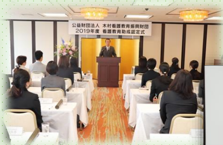
看護研究助成・ CNS奨学金贈呈式