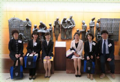
海外看護研修助成 (米国・メイヨークリニック)

当財団は海外看護研修助成・看護研究助成・CNS奨学金助成・講演会開催など各種事業を通じて、看護職の皆様の活動を応援しています。