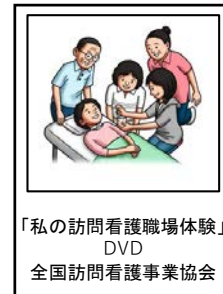
「私の訪問看護職場体験」 DVD 全国訪問看護事業協会