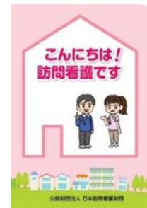
地域での訪問看護の発信に向けたツールの送付