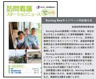
機関誌 訪問看護ステーション ニュースでNursing Nowの紹介