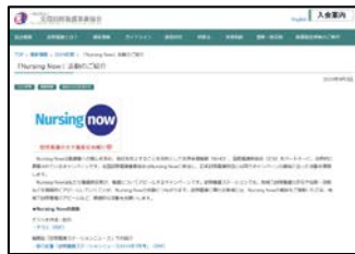
キャンペーンWEBページの作成