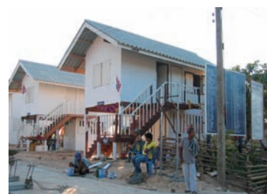
写真 5. 復興住宅