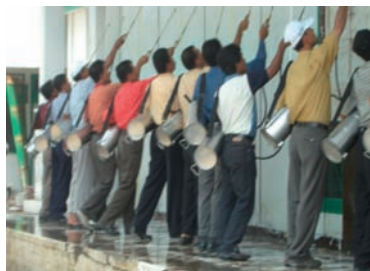
写真 14. Uleelehue