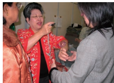
写真 47. メーキャップ用品

飛行機事故を想定し、学生が被災者役と医療班役に分かれトリアージの演習を行った。被災者役はメーキャップを行って演技をし、医療班役は実際にトリアージタグを使用してトリアージを行った（写真47～50）。