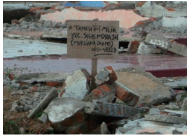
写真 11. 土地所有者を示す札