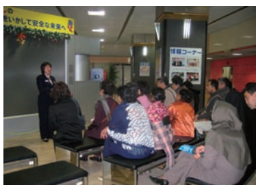
写真 40. オリエンテーション

立川防災館にて救急訓練、消火訓練、防災ミニシアター、煙体験、および地震体験の5つのプログラムの体験学習に参加した。研修参加者はメモや写真を取り、熱心に参加していた（写真 40～45）。防災館の利用者の数やどのような人が利用するのか等の質問が相次いだ。