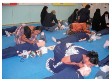
写真 41. 救急訓練