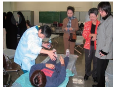
写真 50. トリアージ演習