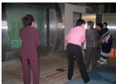
写真 43. 消火訓練