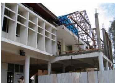
写真 16-18. Zainal Abidin 病院

従来、この病院の病床数は 400 床であったが、津波被害により 200 床に減床した (写真 16)。また、看護師総勢 397 名のうち 42 名が死亡、120 名が行方不明となり、現在は約 230 名まで減少したが、今後新たに 120 名を採用する予定である。被災直後は、看護師の多くが家族や住居および所持品全てを失い、働ける状態ではなかったが、2005 年 3 月頃より徐々に勤務できるようになってきた。メンタルケアはメルシー (マレーシアの NGO) からの協力を得ており問題ない。今の問題は、看護師の衣食住の確保である。看護部長より本会に看護師のシンボルであるユニフォーム (白衣) 製作のための資金援助の依頼があった。政府からの白衣の支給は一人につき 1 セットのみであり、私服で働いている看護師も