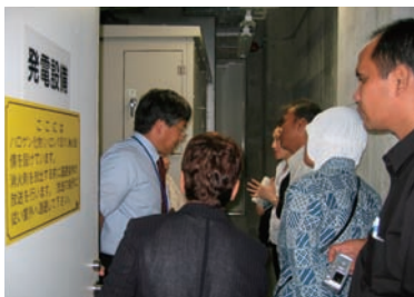
写真 33. 非常用発電機の説明

研修のまとめとして、研修参加者の感想が述べられた。また、災害看護ワークショップ（インドネシア看護師協会主催）の具体的な支援内容については、ワークショップの開催要綱に基づいて後日あらためて検討されることとなった。