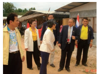
写真 60. NAT 役員たち

NAT理事および政府関係者が、仮設住宅および避難所の津波被災者を訪問した。これらの地域では、ニーズ調査と保健サービスが実施されている。また、NATは、「看護師協会ヴィレッジ」と名づけた住居提供プロジェクトを実施した。同プロジェクトにより、政府による住居提供プ