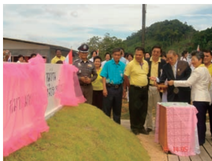
写真 62. 災害看護センター

NAT は、2004年12月の津波の後、災害救援センターとしての働きを担ってきた。災害看護教育および研究に関わる看護師の需要増加をうけ、2006年6月20日に災害看護センターの設立が決定された。同センターの設立のきっかけを作ったのはJNAで、JNAはその設立支援も行っている。センターの目的は、看護師、