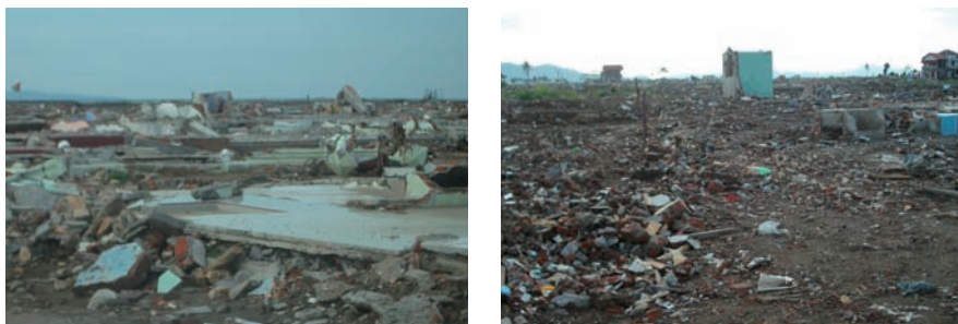
写真 1 (左). 2 (右) インドネシア看護師協会アチェ支部の事務所があった地域

インドネシアにおける津波による死亡者は 166,760 名、行方不明者は 127,749 名、避難者は 81 万人以上であった。最も被害が大きいアチェ州では 21 県のうち 13 県が被災した。2005 年 3 月に被災地を視察した時のインドネシア看護師協会長からの報告によると、アチェでは約半数の看護師が死亡したため、被災直後の看護師の不足が課題となった。また、インドネシア看護師協会アチェ支部の事務所は津波で全壊したとのことであった（写真 1-2）。