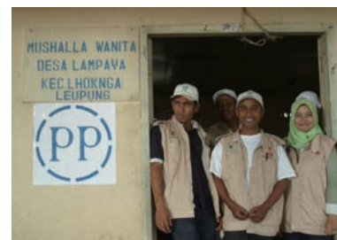
写真 21. ヘルスサテライト