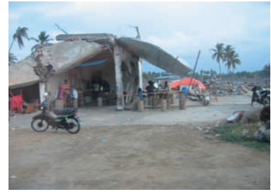
写真 12. 被災者たち