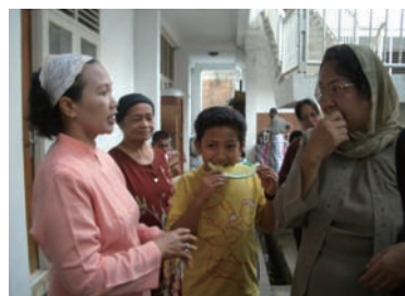
写真 20. Nursing Dormitory