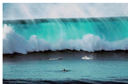
写真 67. 68. 津波災害

スリランカの看護の発展に対する日本看護協会 (JNA) の支援に深く感謝いたします。津波後の調査に JNA の代表者が被災状況を視察したことは、スリランカの看護師にとって忘れられない体験となりました。また、スリランカの看護師 3 名が日本でのワークショップに参加できたことに対して、JNA の皆様に深く感謝いたします。