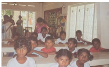
写真 76.-78. SLNA の活動

災害が発生した場合は、SLNA会長あるいは、医療サービスおよび公衆衛生担当の看護ディレクターと支援活動について調整することを提案する。このような状況では、短期的協力も長期的協力も必要で、また、経済的支援も物質的支援も必要となるであろう。