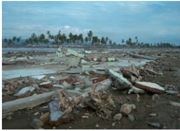
写真 10. 旧アチェ支部跡