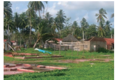
写真 57. 58. 津波で破壊された建物

海岸部にはまだ津波災害による損害を受けた建物が多くみられた。それらはブロックを積み重ねたり、細い柱に支えられたりして建てられた家屋であり、基礎部分を残して全て津波にさらわれたものもあった。被災した家屋の多くは海岸部から数十メートル以内に建てられており、現在は、海岸から100メートル以内の家屋の建設が禁じられているために、修復しても住めず放置されているとのことであった。