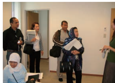
写真 32. カウンセリングルーム