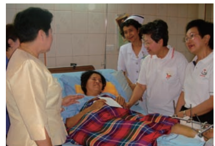
写真 63. 被災者の訪問

NATは、JNAからタイの看護師が災害看護管理について学ぶ多くの機会を提供されたことを実感している。JNAの惜しみない支援は、資金援助を通じて間接的に、被災者とその家族への住居提供事業にも役立っている。