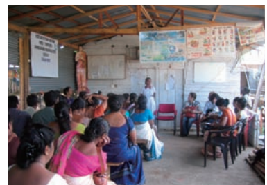
写真 54. 仮設住宅群の集会所