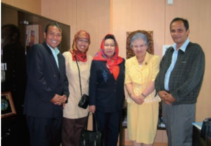
写真 26. 地域ケア開発研究所所長室にて