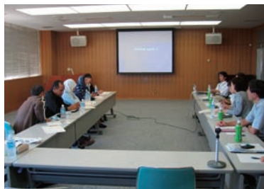
写真 31. 兵庫県こころのケアセンター