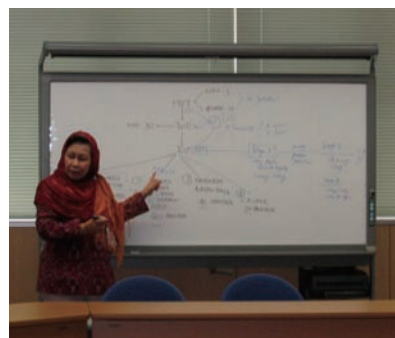
写真 35. インドネシア看護師協会会長による説明

して教育し、その MOT が 30 名のTOT (Trainers of training) を教育する。そして、TOT は各地の看護師合計 330 名を指導する予定である。2005 年 9 月現在、MOT および TOT