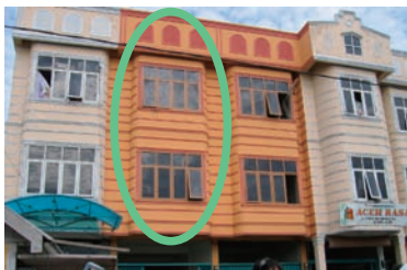
写真7. 8. アチェ支部

津波により全壊したため、GOAL（アイルランドのNGO）から1年間の賃貸料（5千万ルピア、日本円にして約57万円）の提供を受け、現在の建物（外観:写真7、内装:写真8）に移り活動を再開した。主なスタッフは12名でトレーニングセンターと訪問診療の拠点を兼ねている。また、GOALよりパソコン、机、棚、椅子、オートバイ等の備品の提供を受けたが、まだ備品が足りない状況である（写真9はインドネシア看護協会アチェ支部のメンバーとGOAL代表者）。