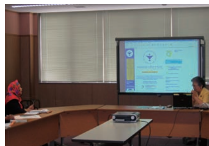
写真 25. ICN の災害看護の取り組み