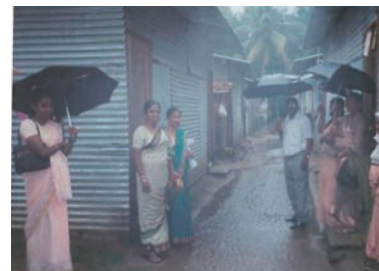
写真 71. 72. 被災地視察

私はSLNA会長として、2006年5月19日から20日に行われた看護界のリーダー、助産師協会代表者、規制担当者による個別会議、5月20日から21日までの世界保健医療専門職同盟会議、5月17日から18日の三者会議に出席したが、これはJNAの支援によるものであった。こうした会議で得た経験と知識に感謝すると共に、SLNAの今後の