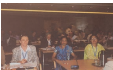
写真 73. 74. CNR・ICN大会