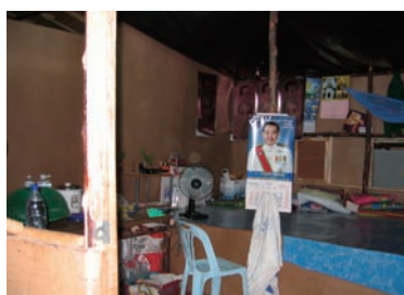
写真 4. 仮設住宅