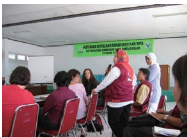
写真 19. アチェ州衛生局

ヘルスサテライトの医療チームメンバーは 25 歳～30 歳であり、保健センターでの勤務経験者が多い（写真 21）。ヘルスサテライトは 24 時間態勢で、2 交替制もしくは 3 交替制であった。看護師の休憩室もあり、エアコンも完備していた。待遇は、医師は 6 ヶ月契約で 500 万ルピア（約 5 万 7 千円）/月、看護師は 3 ヶ月契約で 200 万ルピア（約 2 万 3 千円）/月である。