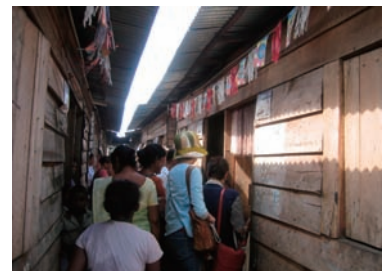
写真 53. 仮設住宅群