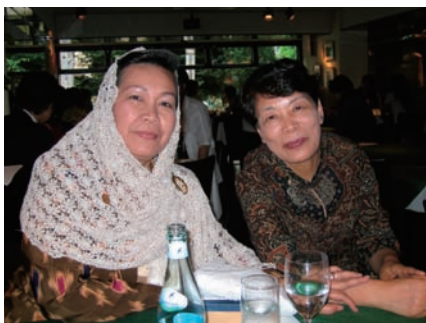
写真 36. インドネシア看護師協会長と本会会長

会長は日本の看護師と本会への感謝の意を述べ、今後も連携して活動していきたいと語った。