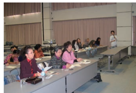
写真 38. 講義