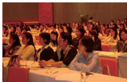
写真 61. 災害看護の研修

また、2005年9月1日から2日には「リーダーシップと災害管理—理論と実践経験」をテーマに災害看護ワークショップが開催された。このセミナーでは、被災地域の看護リーダーが400名の看護師を対象に津波被害時の管理経験について語り、JNAより災害看護の専門家である黒田裕子氏が基調講演者として派遣され、日本の阪神・淡路大震災時の管理経験についての講演を行った。この講演により、NATの会員におけるタイの災害管理への活動意欲が高まった。