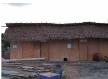
写真 3. 仮設住宅

現地は瓦礫等が残っているところもあるが、復興作業が開始されていた。家を失った被災者は被災した地域ごとにキャンプ地に集まり、ベニヤ板のような素材でできた仮設住宅で生活している(写真3-4)。キャンプ地は海岸沿いから離れており、被災者は住んでいた海岸沿いに戻るか、内地へ移動するか意見が分かれている。一方で復興住宅(写真5)の建設も始まっていた。復興住宅の建設費用は1軒あたり10万バーツ(約33万円)。キャンプ地には近隣の病院から看護師が派遣され、健康問題の早期発見や健康相談の対応等を行っている。しかし、看護師が派遣される頻度、時間など住民への関わり方はキャンプ地により異なっていた。