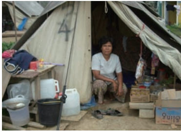
写真 22. 23. キャンプ地