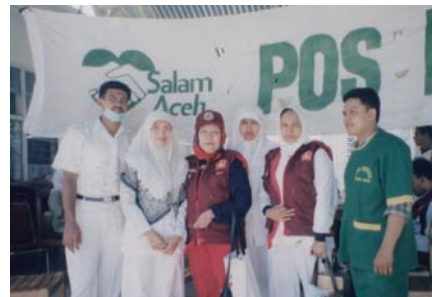
写真 64. INNA の役員・スタッフたち

2004 年 12 月 26 日、スマトラ島北部西岸沖で、マグニチュード 9.0 の大地震が発生した。この地震が引き起こした強大な津波は高さ 10m にもなる水の壁となって、インドネシアのナングロ・アチェ・ダルサラーム (NAD) と北スマトラの 2 州の海岸地域を襲った。この災害の被害を受けた国は他にもあり、マレーシア、タイ、ミャンマー、スリランカ、インド、ソマリア、モルディブ、タンザニア、バングラデシュ、セイシェル、ココス諸島、モーリシャス、レユニオン (USGS のデータによる) などである。津波の破壊的な影響は、インドネシアを越えた遠方まで及んだ。