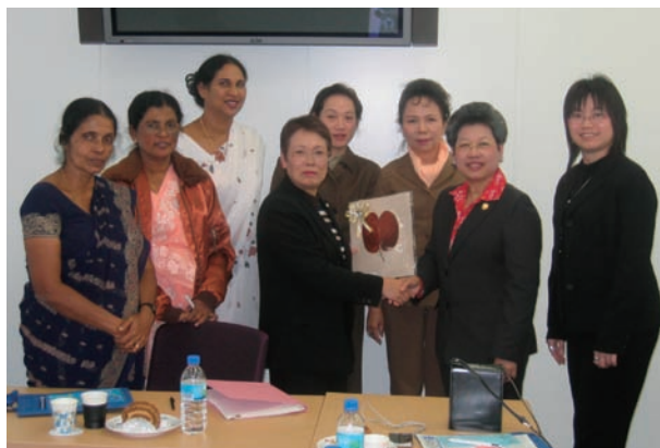
写真 51. 研修参加者と本会役員