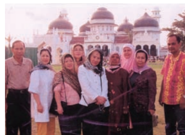
写真 65. ICN 会長のアチェ訪問

カルタで開催された。このセミナーおよびワークショップの目的は、INNA と JNA が看護師の災害管理能力の育成と一般市民の啓発に関して幅広い支援活動を企画・実施するということであった。セミナーは、インドネシア全体からおよそ 200 名の看護師が出席し、ワークショップには 65 名の看護師が参加した。