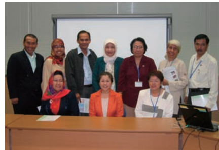
写真 28. 2005 年度インドネシア地域看護コーディネーター育成研修の研修生と

研修参加者からは日本の仮設住宅についての質問が相次ぎ、また、インドネシアで今後懸念される問題とその対応について活発な質疑応答が行われた。