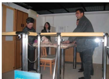
写真 44. 地震体験