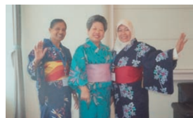
写真 75. 津波シンポジウム