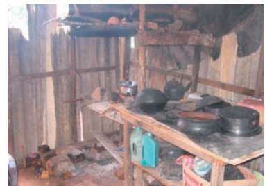
写真 56. 恒久住宅

恒久住宅は、あるベルギー人の寄付により建設され、1件あたり約70万ルピー（約77万円）の建設費を要しているが、ブロック塀にトタン屋根という構造で、サイクロンで屋根が損壊した家屋も見られた（写真55）。また、1DKに一家4～6人程度が生活しており、ライフラインの設備が不十分で、配電設備と給水車による1回/日の給水はあったが、ガスはなく屋外で薪を用いて調理をしていた（写真56）。住民は、海岸部まで漁に出かけた