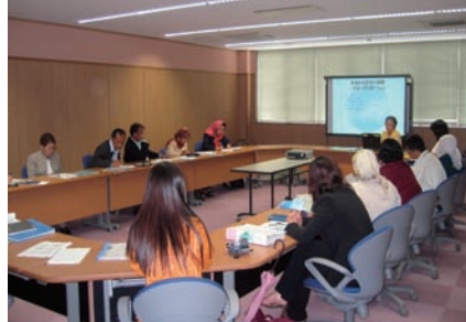
写真 27. 講義風景