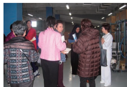
写真 39. 備蓄倉庫