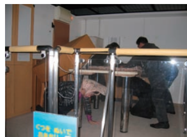
写真 45. 地震体験