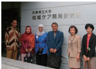
写真 30. 地域ケア開発研究所正面玄関