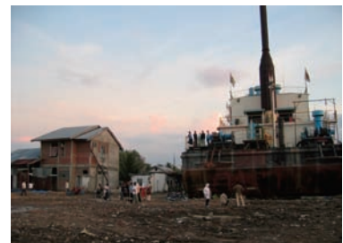
写真 15. PLTD Apung