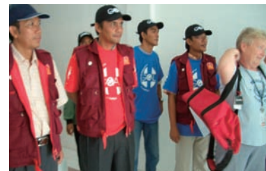
写真9. アチェ支部メンバーたち