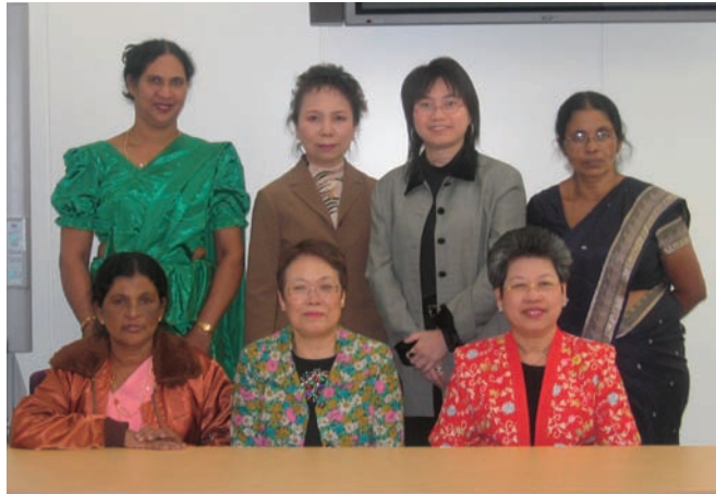
写真 37. 研修参加者と本会役員

災害医療ネットワークの概要やネットワークを活用した初期災害医療班の派遣体制、災害に関する情報収集・連絡・連携体制、災害訓練、災害時に対応できる看護師の養成について講義があった（写真38）。研修参加者からは災害医療センターと国との関係、また、災害に対応できる看護師の養成に関する質疑があった。