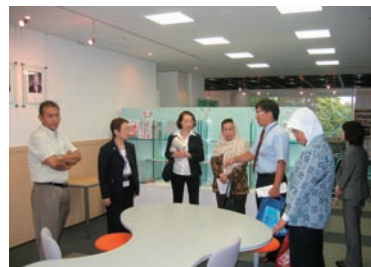
写真 34. 災害時に本部となる会員サロン