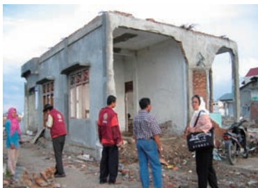
写真 13. Kampung Peulangahan

3千トンの発電船が津波により住宅街に運ばれた。現在、人々が集まるスポットとなっている。