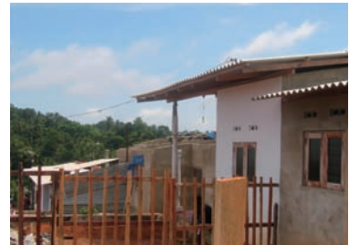
写真 55. サイクロンで屋根が損壊した家屋（左後方）

海岸部から約3キロメートル離れた傾斜地（元ゴム農園）に恒久住宅が建設されていた。近くに配電塔があり、身体への電波の影響が懸念されるために土地が安く、そのために恒久住宅の建設用地に選定されたとのことであった。