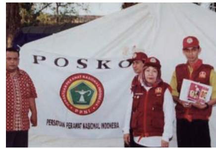
写真 66. INNA 会長とスタッフ

大な損害が出た。その後は、西スマトラ州、ベンクル州、テルナテ島で、地震による被害があった。また、2007年2月には、ジャカルタ首都特別州が洪水による損害を被った。現在、東ジャワ島の一部は、ラピンド社の泥水噴出事故により少しずつ消滅している。地震、地滑り、洪水、乾燥等、その他の自然災害が、インドネシアの多数の州のほとんどの地域で発生している。