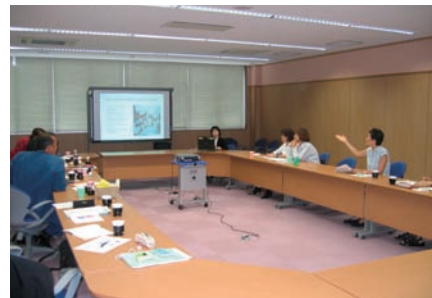
写真 29. 講義風景