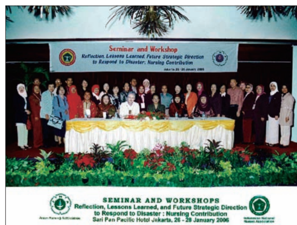
写真 52. インドネシア看護師協会主催ワークショップ