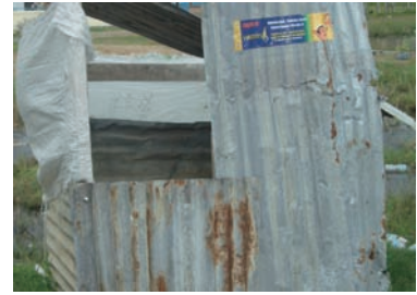
写真 24. キャンプ地のトイレ