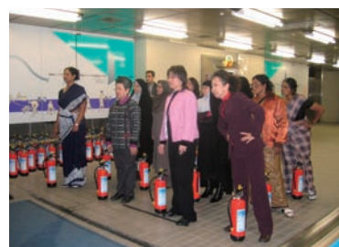
写真 42. 消火訓練