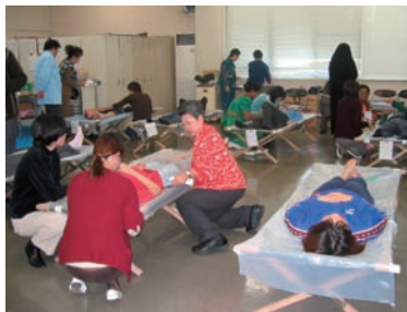
写真 48. 被災者役の学生への演技指導