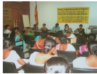
写真 69. 70. 教育支援

この教育プログラムは、津波被災地域の看護師にとって、津波の際の管理体験を共有する機会となり、また、精神的な負担を軽減する一助ともなった。