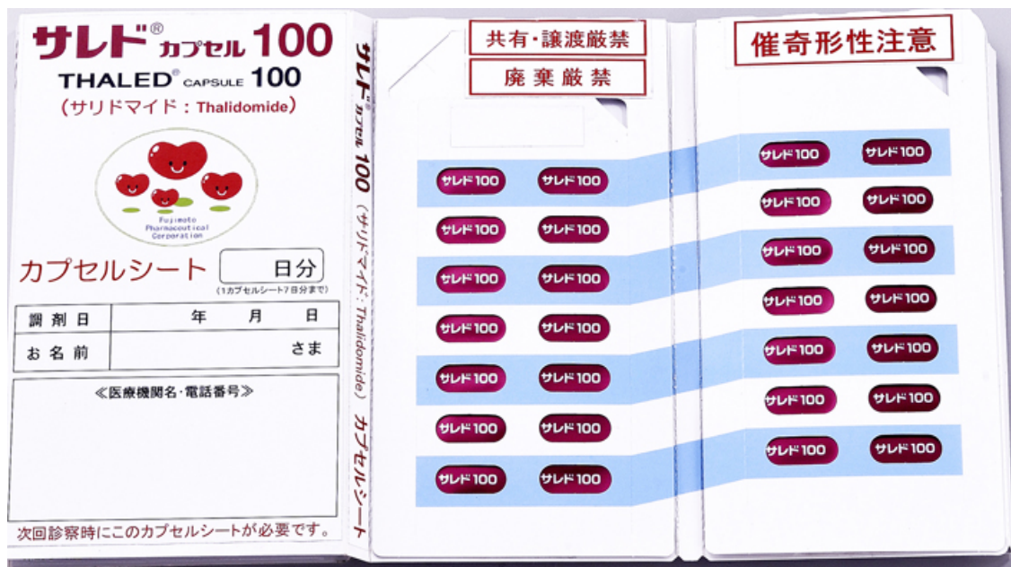
写真2：カプセルシート

医療看護の安全に関する最新情報を掲載しています。安全情報は、管理・システムの視点での対応の必要性を提言し、医療安全のための活動の指針としていただくことを目的としています。どうぞご活用ください。